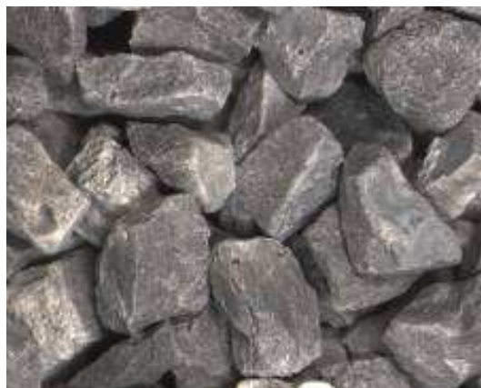
Macrostructure of 1520 AZ25

实验证明， AZ25 1520 在钢坯表面打磨，铸件及焊缝表面修磨等重负荷磨削领域均表现出优越的性能。